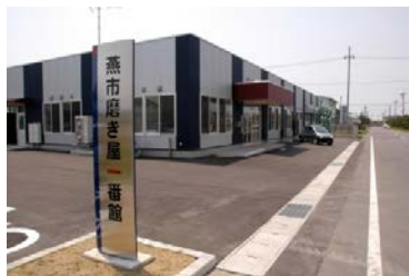
▲燕市磨き屋一番館